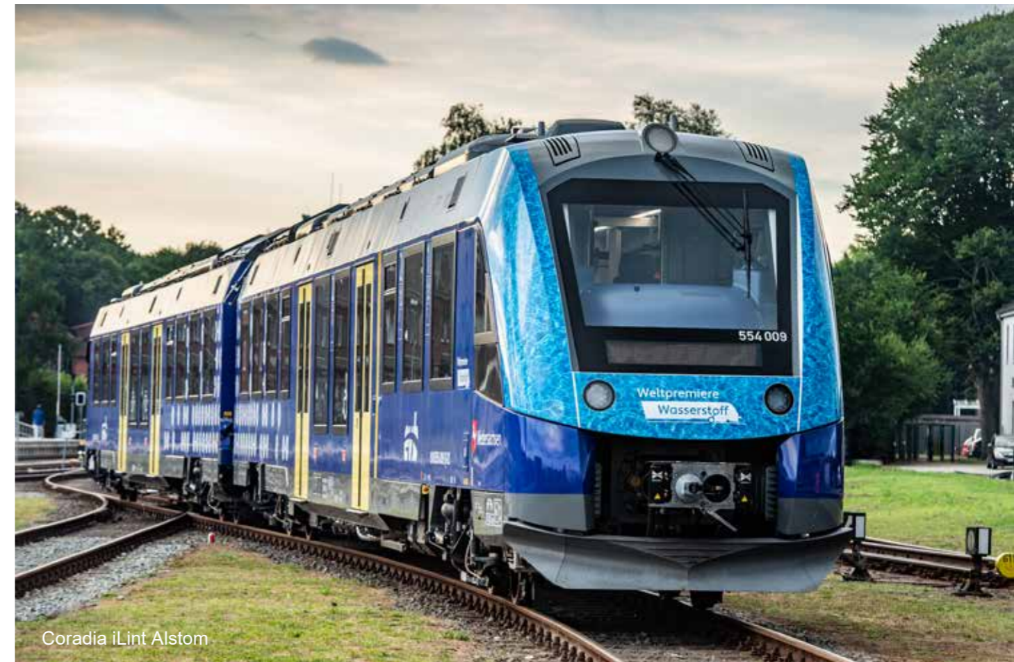
Coradia iLint Alstom