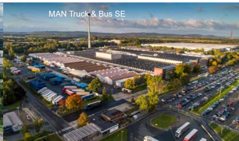
MAN Truck & Bus SE