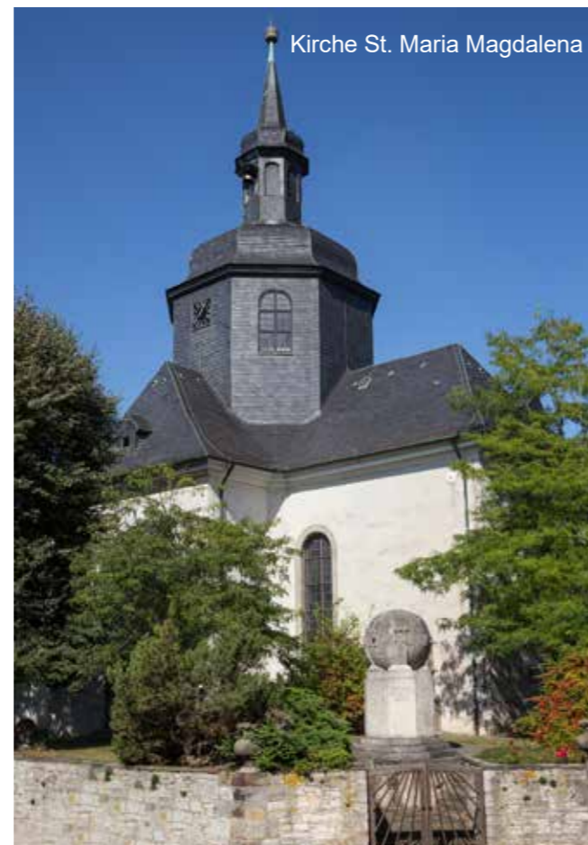
Kirche St. Maria Magdalena

Wehrstr. 14, Salzgitter-Lebenstedt Telefon: 05341/160 08 Internet: www.rumaenisch-orthodox-salzgitter.de