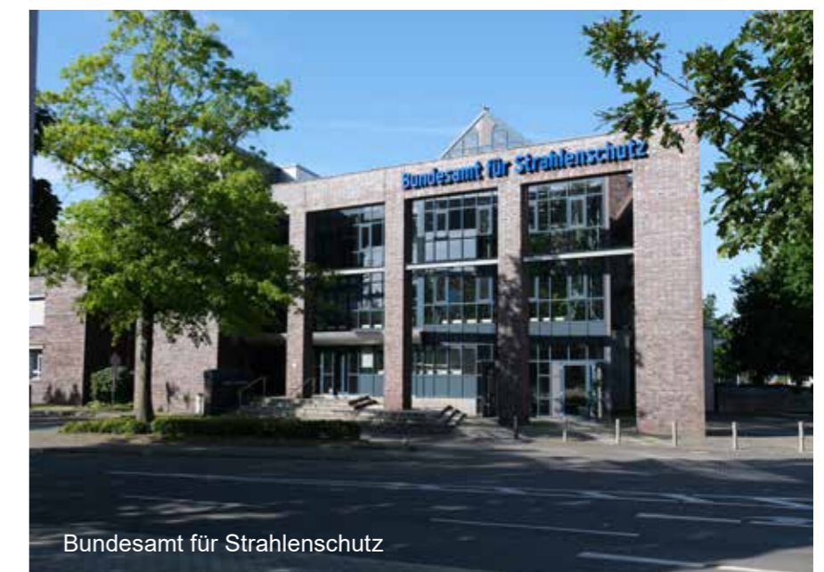
Bundesamt für Strahlenschutz

Windmühlenbergstr. 20 Salzgitter-Bad Telefon: 0170/7286956 E-Mail: kontakt@wvs-salzgitter.de Internet: www.wvs-salzgitter.de