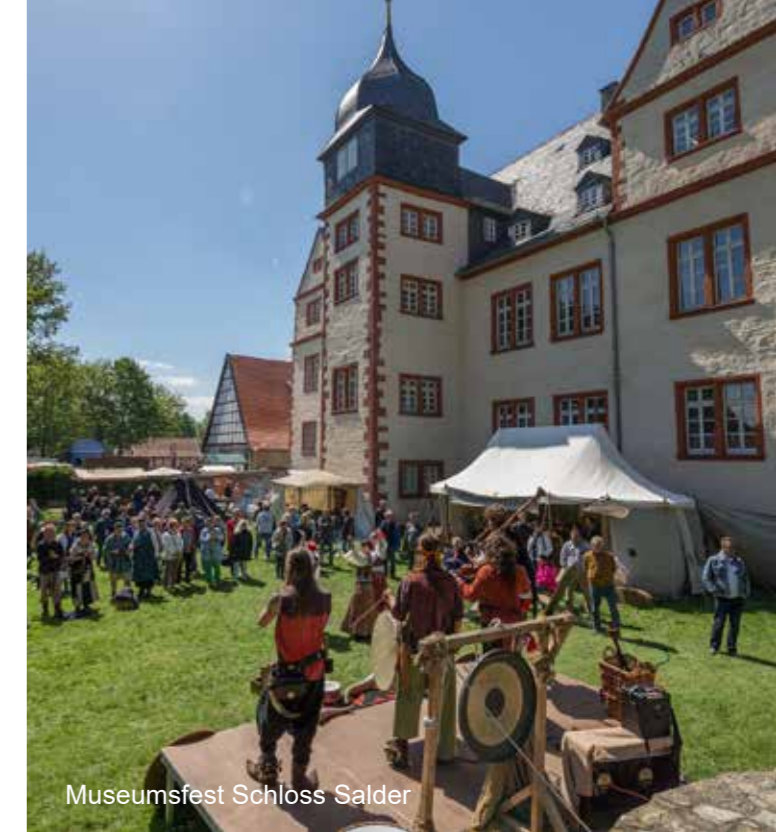
Museumsfest Schloss Salder

Bei der städtebaulichen Planung für diese Großsiedlung setzten sich die Ideen der deutschen und englischen Gartenstadtbewegung aus der Zeit um 1900 durch. Im September 1939 begann der Bau der