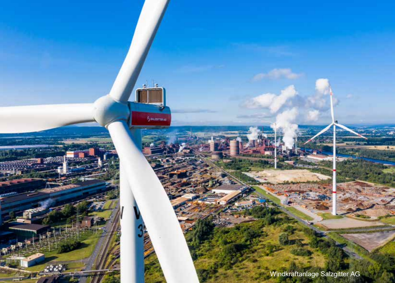
Windkraftanlage Salzgitter AG

Die Volkswagen AG will ihr neues Elektromodell „Trinity“ mit dem klimaneutral hergestellten Stahl produzieren.