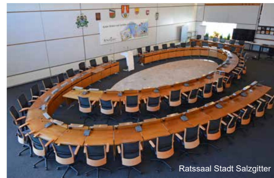
Ratssaal Stadt Salzgitter

Weitere Informationen zum Rat und zu anderen Gremien der Stadt Salzgitter (z. B. Ausschüssen):