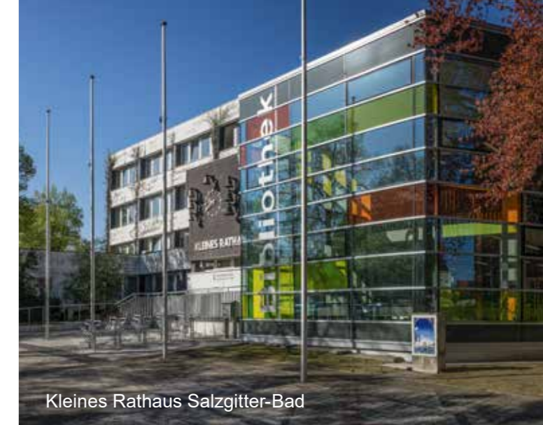
Kleines Rathaus Salzgitter-Bad