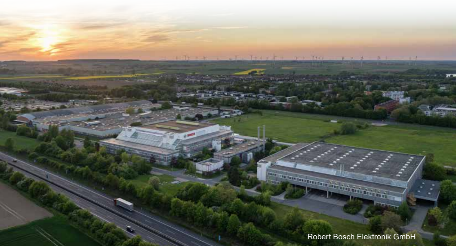
Robert Bosch Elektronik GmbH

Kontakt: Windmühlenbergstr. 20, Salzgitter-Bad Telefon: 05341/900 990 E-Mail: info@wis-salzgitter.de Internet: www.wis-salzgitter.de