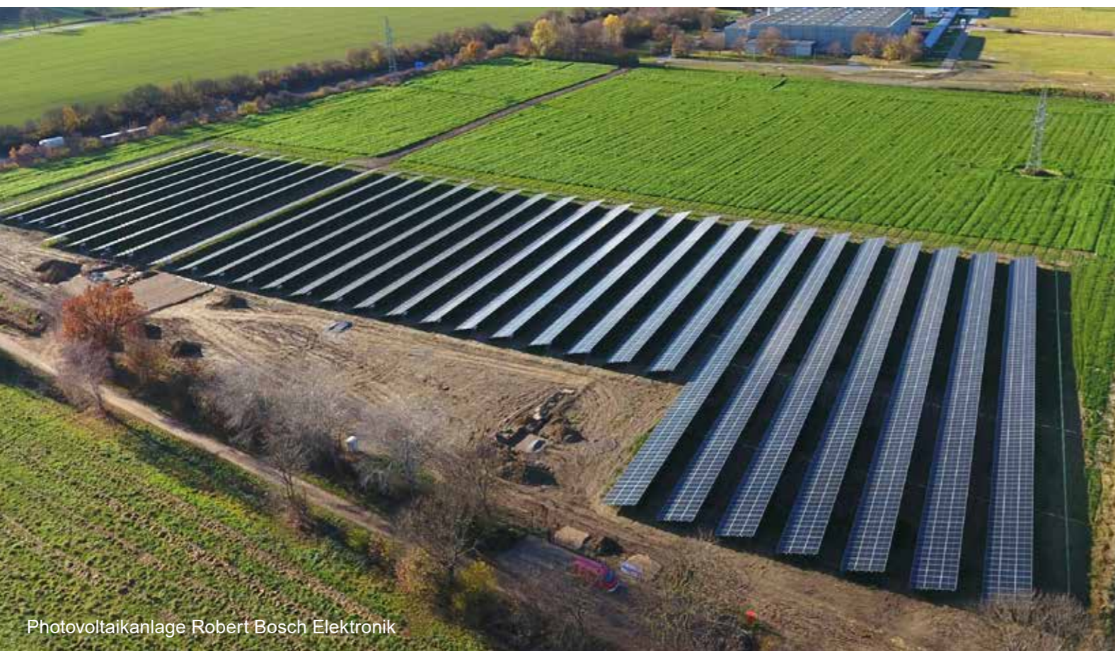
Photovoltaikanlage Robert Bosch Elektronik

Die WEVG Salzgitter GmbH & Co. KG ist Energie- und Wasserlieferantin für Salzgitter. Die beiden Gesellschafter der WEVG, die Avacon AG sowie die Stadt Salzgitter, vereinen das Know-how rund um die Energieversorgung mit der Regionalität vor Ort.