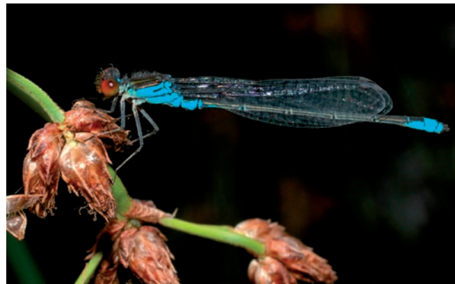
▼ Das Große Granatauge

Hinter dem Neuen Teich fließt die Warne durch Felder und Grünland, wobei sie abschnittsweise von schönen Roterlen gesäumt ist. Diese Bäume bilden eine natürliche Uferbefestigung und bereichern das Landschaftsbild ganz erheblich. Besonders oberhalb des Salgenteiches sind vom Weg aus sehr schöne, den Bach einrahmende Roterlen zu bestaunen. Der Salgenteich ist ebenfalls ein alter Stauteich. Wie auch im Neuen Teich ist in einigen Bereichen eine beginnende Schilfröhricht-Bildung zu erkennen. Hinzu kommt ein größerer Bestand des Schmalblättrigen Rohrkolbens. Ab hier bis zum Schützenplatz wird die Warne verrohrt unter Salzgitter-Bad hindurchgeführt.