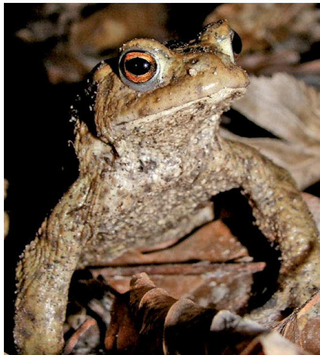
▼ Erdkröte am Neuen Teich

Im Wald ist der Verlauf der Warne annähernd natürlich. Das Bächlein kann sich hier weitestgehend frei seinen Weg suchen. Doch spätestens vom Waldrand an ist der Bach begradigt, und für den Neuen Teich wurde er sogar umgelegt. Auch durch die Felder und Wiesen verläuft der Bach stark begradigt. Lediglich der Bewuchs aus Roterlen und anderen Gehölzen verleiht ihm sein natürliches Aussehen. Es wird angestrebt, den Verlauf des Baches nicht noch weiter einzutiefen und ihm die Möglichkeit zu lassen, aus dem vorgegebenen Bett etwas auszubrechen um selten gewordene natürliche Abbruchkanten und einen schlängelnden, strukturreichen Bach in der Landschaft entstehen zu lassen.