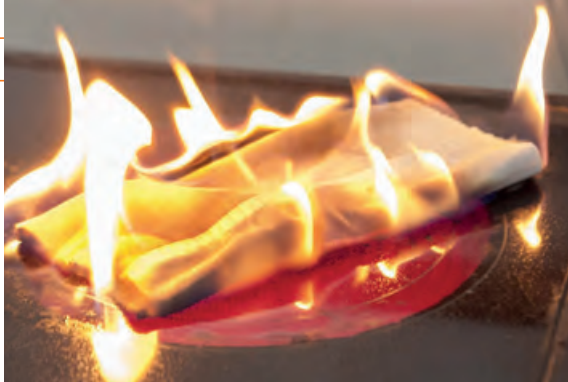
Eine der häufigsten Ursachen für Feuer in der Küche: Ein Handtuch, das auf einer eingeschalteten Herdplatte liegt