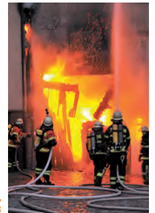
Hausbrand in Monschau, Nordrhein-Westfalen 2008