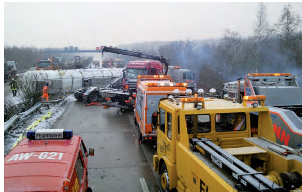
Schwerer Unfall eines Gefahrgut-LKW